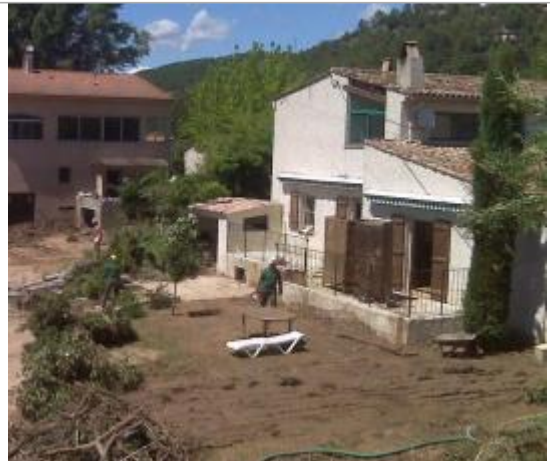
Vue du site - Auteur : SAFEGE

Coordonnées WGS84 : X: 6.42499000 / Y: 43.45352600