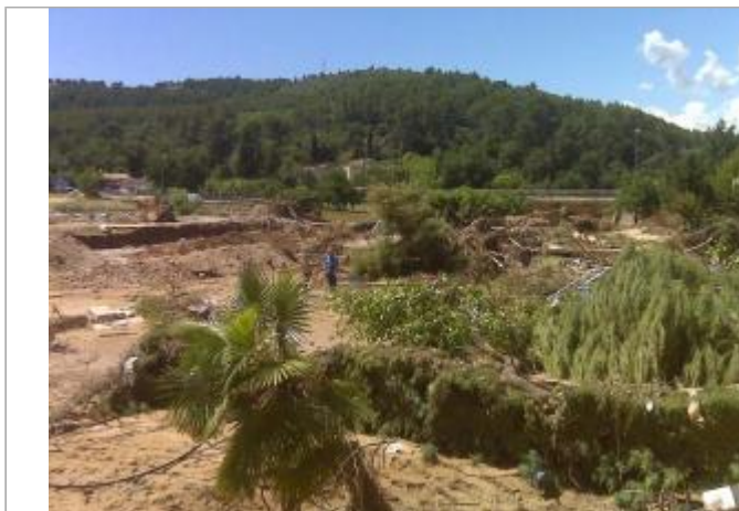
Vue du site - Auteur : SAFEGE