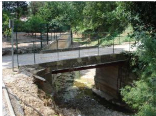
Vue du site - Auteur : Cerema Méditerranée