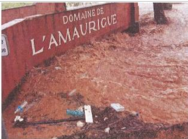
Vue en crue

Différence entre le niveau d'eau et la référence (en m) : 0.000 m