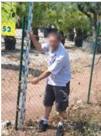
Vue du repère - Auteur : Cerema Méditerranée

Différence entre le niveau d'eau et la référence (en m) : 0.800 m