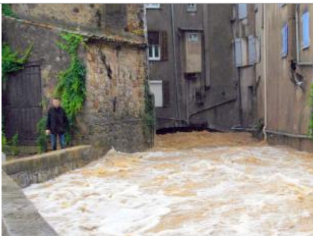
Vue en crue

Différence entre le niveau d'eau et la référence (en m) : 0.500 m