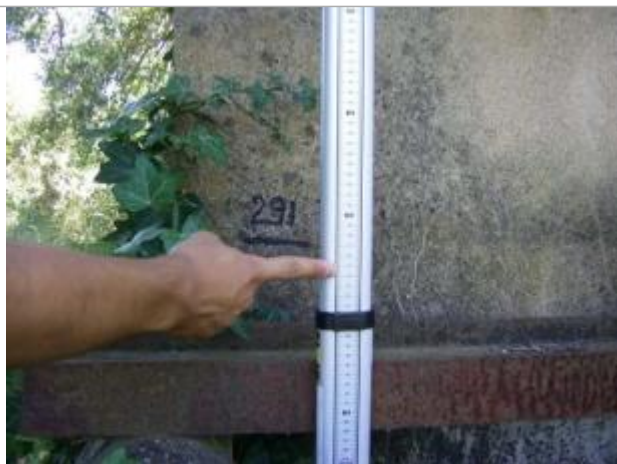
Vue de la PHE - Auteur : EGIS

Altitude calculée de l'eau (en m) : 103.47 m