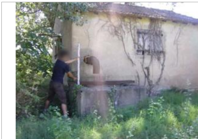
Vue du site - Auteur : EGIS