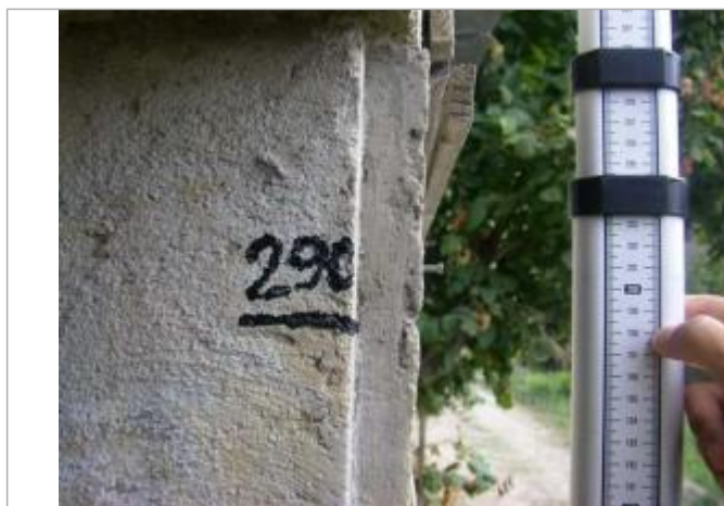
Vue de la PHE

SOURCE DE REPÉRAGE : RECUEIL DE LAISSES DE CRUES DE L'ÉVÉNEMENT DU 15 JUIN 2010 SUR LES COMMUNES DE DRAGUIGNAN, TRANS EN PROVENCE, LA MOTTE ET LE MUY - 01/09/2010