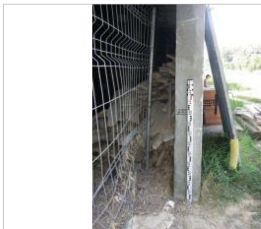
Vue de la PHE - Auteur : EGIS

Altitude calculée de l'eau (en m) : 111.96 m