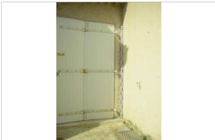
Vue de la PHE - Auteur : EGIS

Altitude calculée de l'eau (en m) : 152.04 m