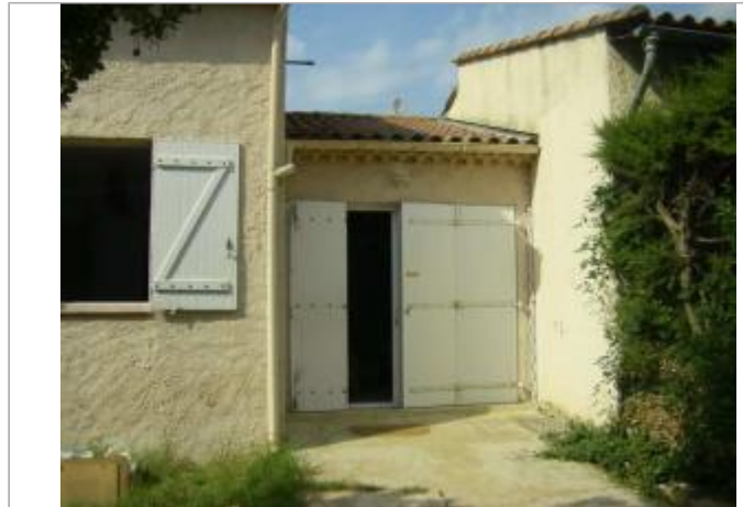
Vue du site - Auteur : EGIS