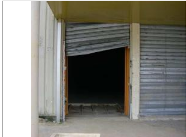
Vue du site - Auteur : EGIS