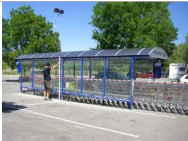
Vue du site - Auteur : EGIS