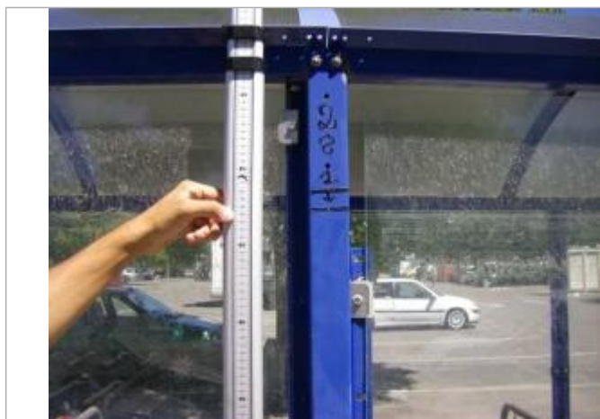
Vue de la PHE - Auteur : EGIS

Altitude calculée de l'eau (en m) : 155.19 m