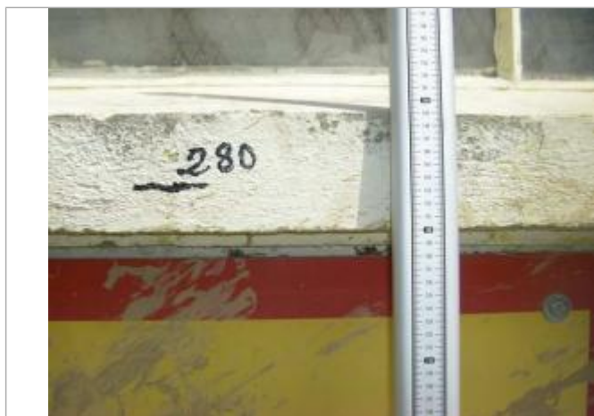
Vue de la PHE - Auteur : EGIS