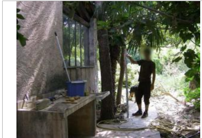
Vue du site - Auteur : EGIS