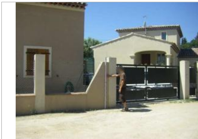
Vue du site - Auteur : EGIS