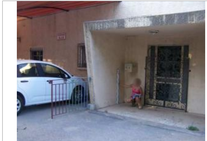
Vue du site - Auteur : EGIS