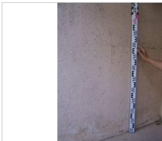
Vue de la PHE - Auteur : EGIS

Altitude calculée de l'eau (en m) : 175.54 m