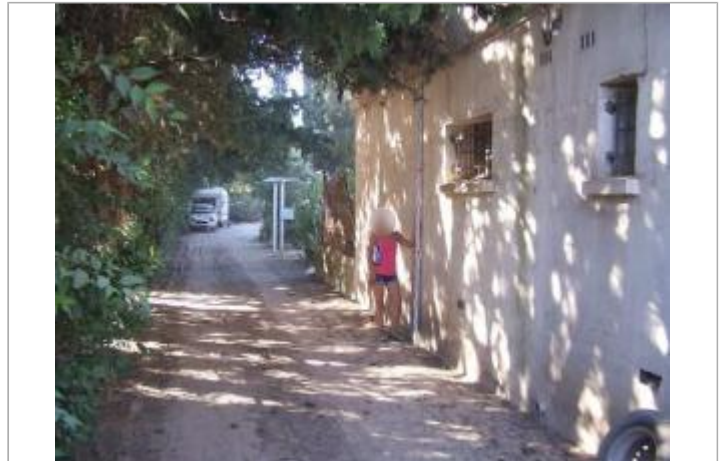
Vue du site - Auteur : EGIS