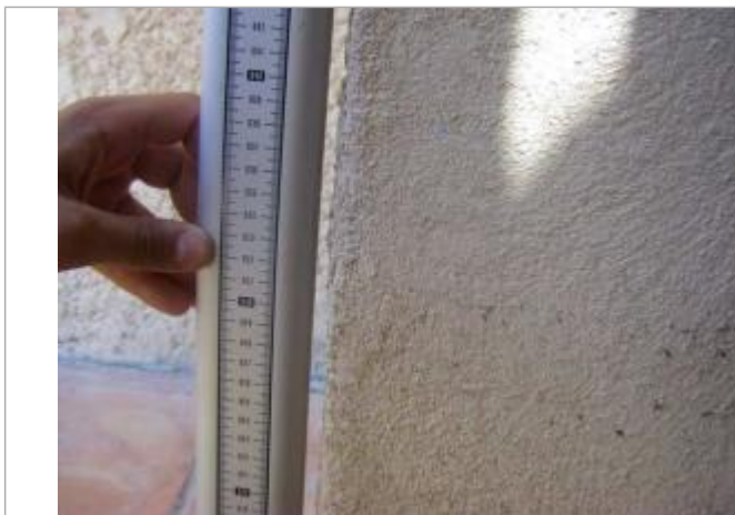
Vue de la PHE

Altitude calculée de l'eau (en m) : 178.59 m