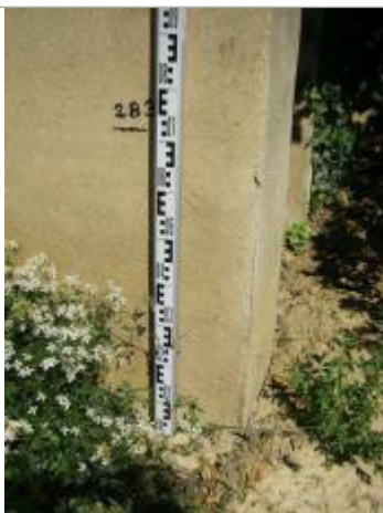
Vue de la PHE - Auteur : EGIS

Altitude calculée de l'eau (en m) : 190.05 m