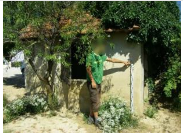
Vue du site - Auteur : EGIS