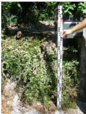
Vue de la PHE - Auteur : EGIS

Altitude calculée de l'eau (en m) : 228.08 m