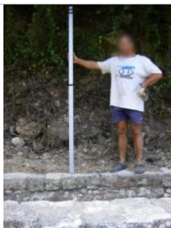
Vue de la PHE - Auteur : EGIS