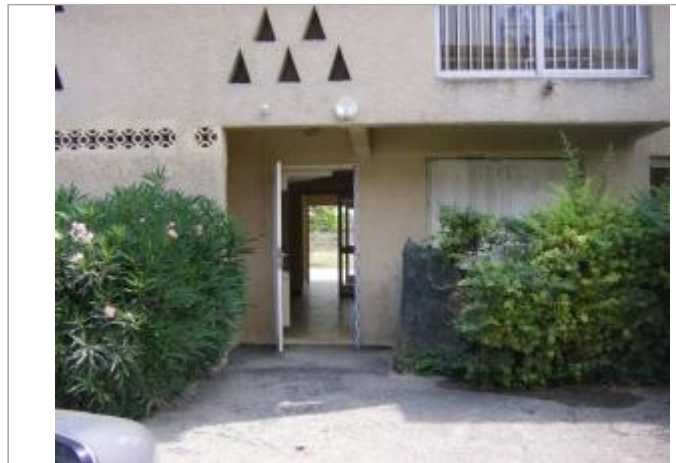
Vue du site - Auteur : EGIS