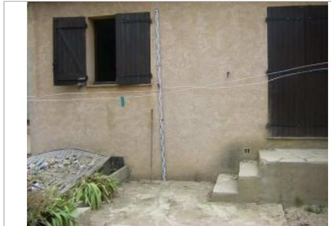
Vue du site - Auteur : EGIS