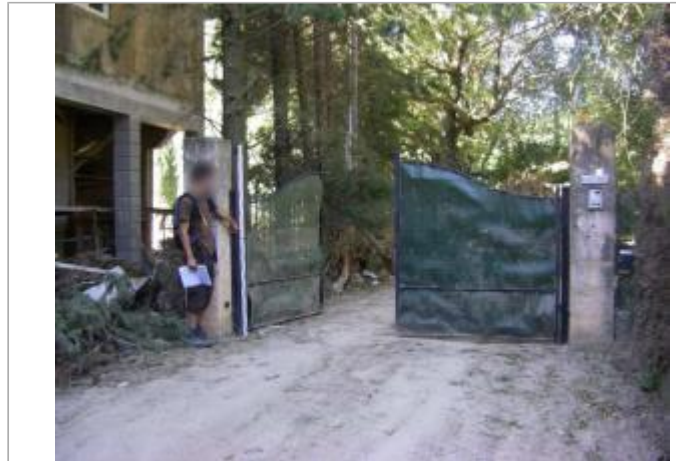
Vue du site - Auteur : EGIS