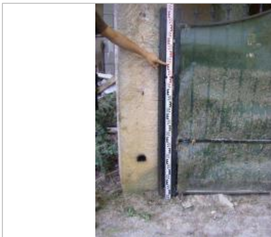
Vue de la PHE - Auteur : EGIS

Altitude calculée de l'eau (en m) : 161.35