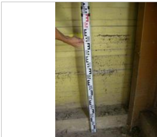
Vue de la PHE - Auteur : EGIS

Altitude calculée de l'eau (en m) : 167.39