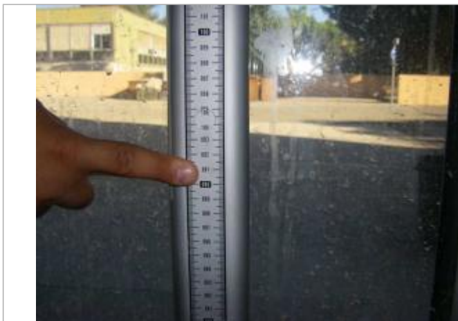
Vue de la PHE - Auteur : EGIS

Altitude calculée de l'eau (en m) : 168.02