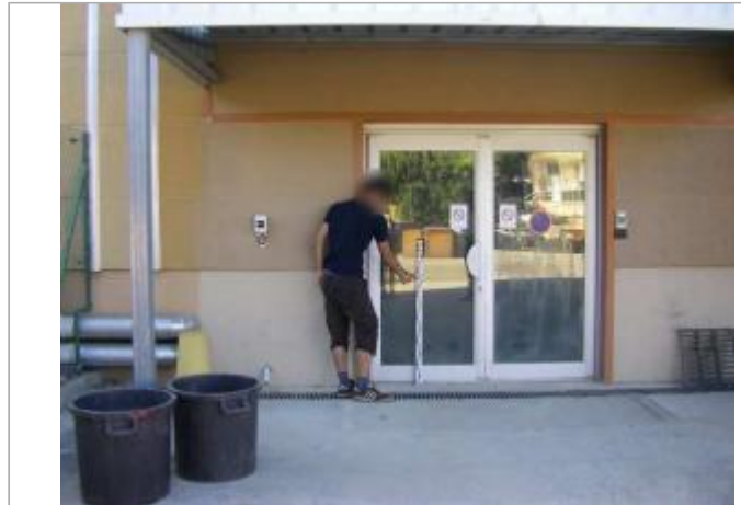
Vue du site - Auteur : EGIS