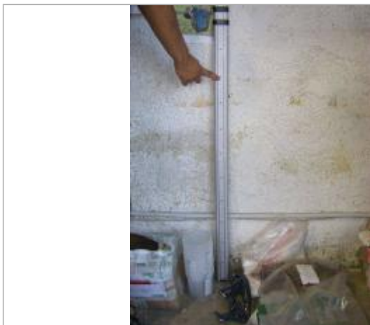
Vue de la PHE - Auteur : EGIS

Altitude calculée de l'eau (en m) : 169.09