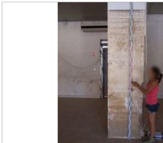
Vue de la PHE - Auteur : EGIS

Altitude calculée de l'eau (en m) : 175.43