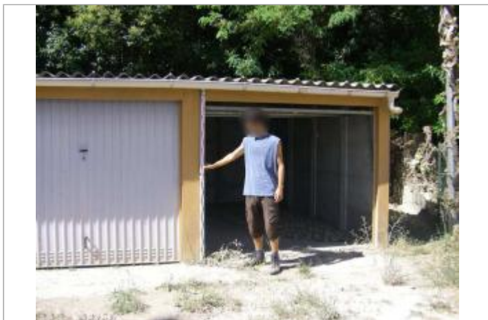
Vue du site - Auteur : EGIS