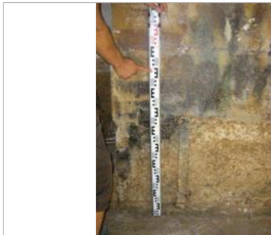
Vue de la PHE - Auteur : EGIS

Altitude calculée de l'eau (en m) : 197.1