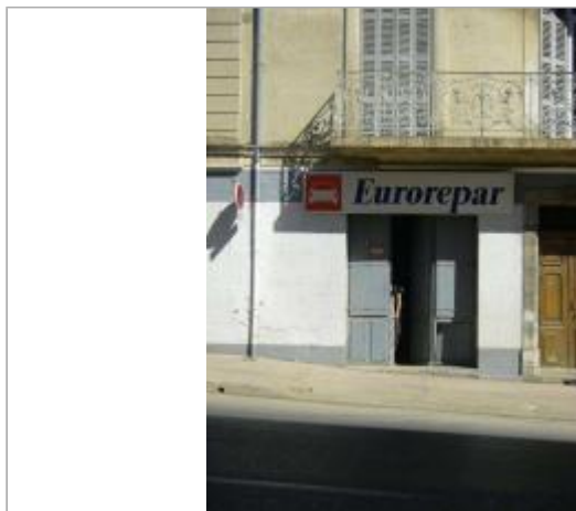
Vue du site - Auteur : EGIS