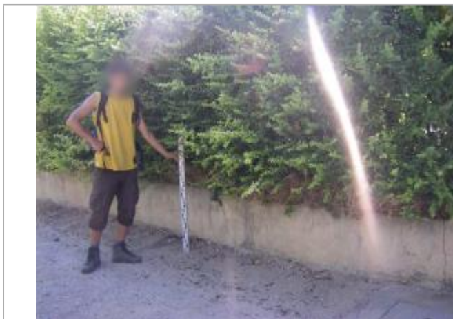
Vue du site - Auteur : EGIS