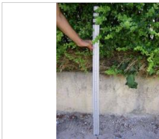
Vue de la PHE - Auteur : EGIS

Altitude calculée de l'eau (en m) : 186.1