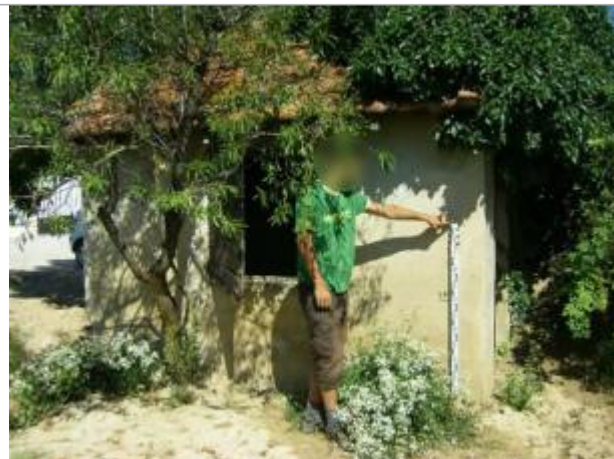
Vue du site - Auteur : EGIS