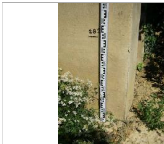
Vue de la PHE - Auteur : EGIS

Altitude calculée de l'eau (en m) : 190.05