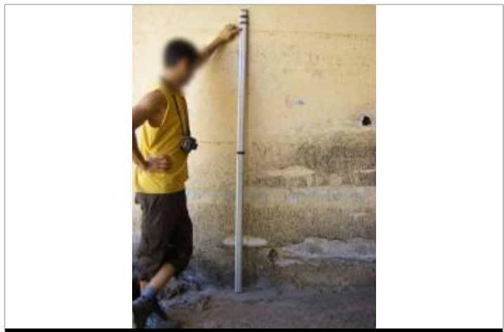
Vue de la PHE - Auteur : EGIS

GÉNÉRAL Code : VAR2010EGN_R_20_1 Date de mise à jour : 02/10/2018 Auteur : Cerema Méditerranée