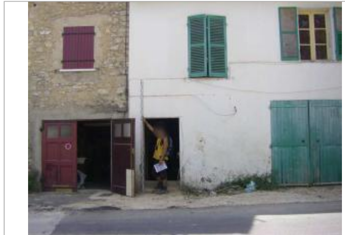
Vue du site - Auteur : EGIS