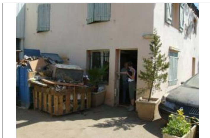
Vue générale - Auteur : EGIS Eau

GÉOLOCALISATION Coordonnées WGS84 : X: 6.71439000 / Y: 43.44302300 Coordonnées RGF93 (Lambert 93) X: 1000717.82 / Y: 6267509.56 Coordonnées RGF93 (ETRS89) : X: 6.71439 / Y: 43.443023 Code Hydro: Y5320600 Rive de référence: Non renseigné