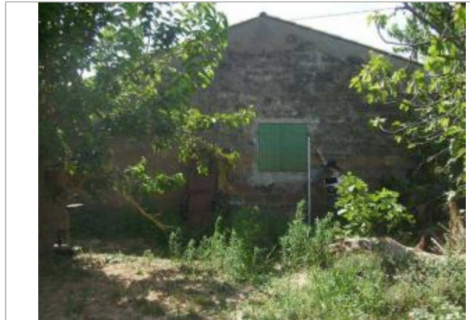
Vue générale - Auteur : EGIS Eau

Coordonnées WGS84 : X: 6.66496500 / Y: 43.44716600