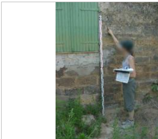
Vue rapprochée - Auteur : EGIS Eau

Altitude calculée de l'eau (en m) : 9.71 m