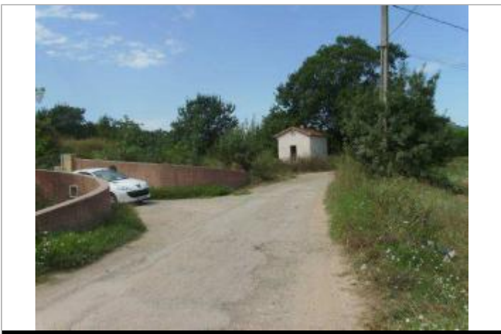
Vue générale - Auteur : EGIS Eau

GÉOLOCALISATION Coordonnées WGS84 : X: 6.66523100 / Y: 43.45293200 Coordonnées RGF93 (Lambert 93) X: 996689.67 / Y: 6268423.8 Coordonnées RGF93 (ETRS89) : X: 6.665231 / Y: 43.452932 Code Hydro: Y5--0200 Rive de référence: Non renseigné