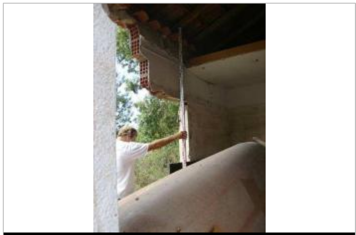
Vue rapprochée

GÉNÉRAL Code : VAR2010EGA_R_087_1 Date de mise à jour : 10/08/2021 Auteur : Cerema Méditerranée