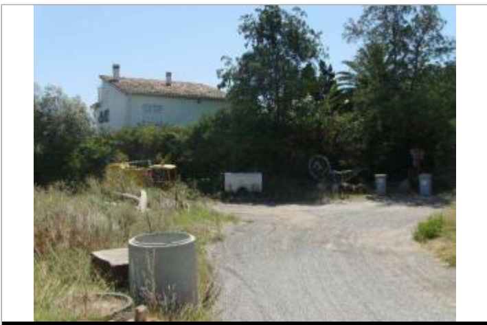
Vue générale - Auteur : EGIS Eau

GÉOLOCALISATION Coordonnées WGS84 : X: 6.64850700 / Y: 43.44271600 Coordonnées RGF93 (Lambert 93) X: 995389.32 / Y: 6267226.79 Coordonnées RGF93 (ETRS89) : X: 6.648507 / Y: 43.442716 Code Hydro: Y5--0200 Rive de référence: Non renseigné