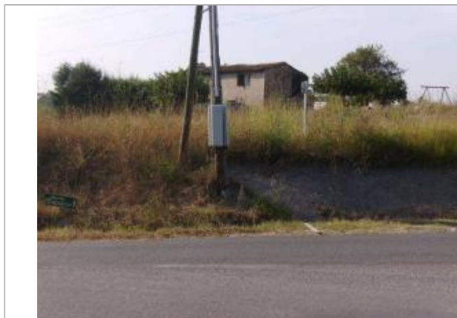
Vue rapprochée - Auteur : EGIS Eau