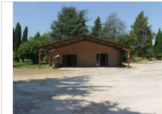
Vue générale - Auteur : EGIS Eau

Coordonnées WGS84 : X: 6.63292700 / Y: 43.45257300