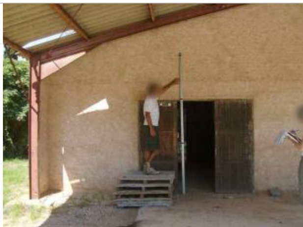
Vue rapprochée - Auteur : EGIS Eau

Altitude calculée de l'eau (en m) : 13.68 m