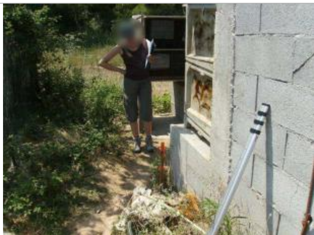
Vue rapprochée

Altitude calculée de l'eau (en m) : 18.43 m