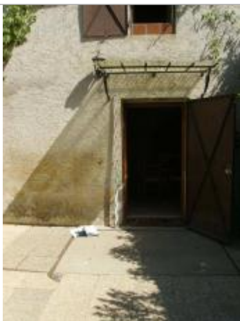
Vue rapprochée - Auteur : EGIS Eau

Altitude calculée de l'eau (en m) : 19.13 m