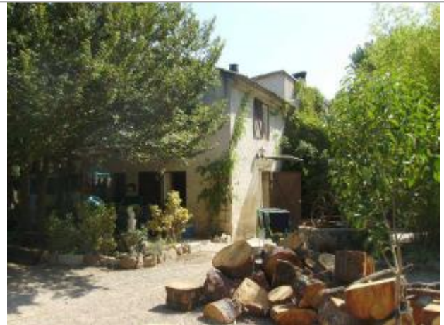
Vue générale - Auteur : EGIS Eau