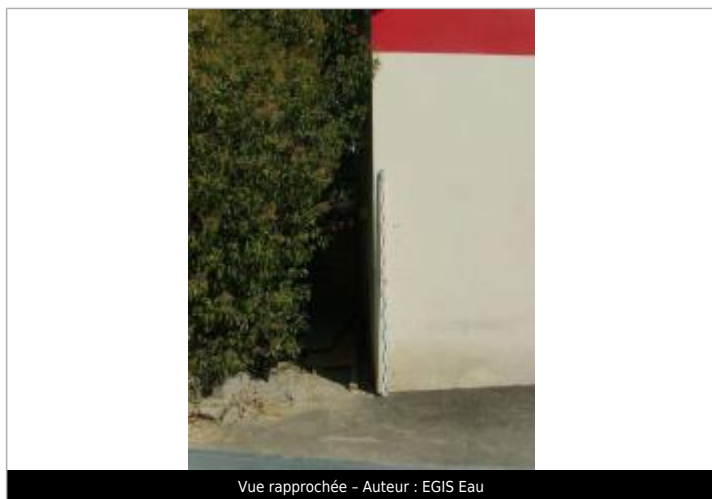
Vue rapprochée - Auteur : EGIS Eau

Altitude calculée de l'eau (en m) : 20.96 m