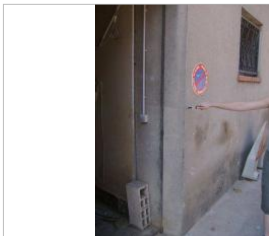
Vue rapprochée - Auteur : EGIS Eau