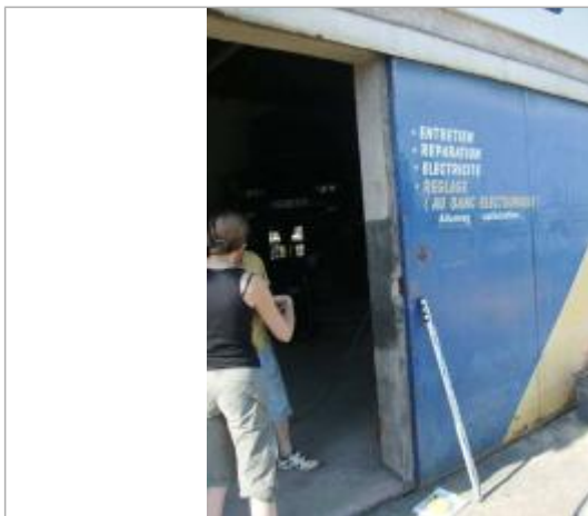
Vue rapprochée - Auteur : EGIS Eau