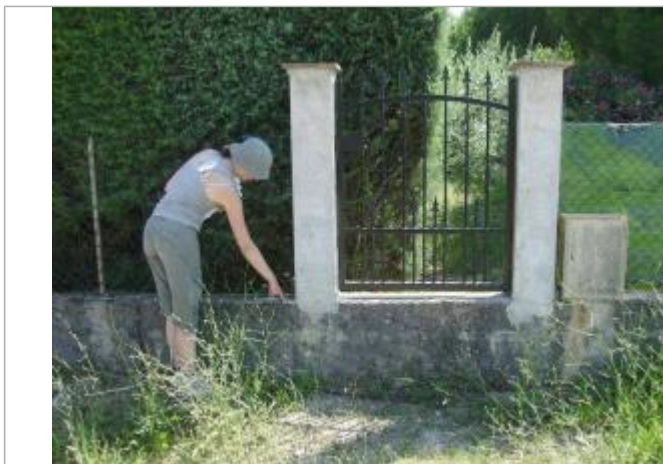
Vue rapprochée - Auteur : EGIS Eau

Altitude calculée de l'eau (en m) : 30.94 m