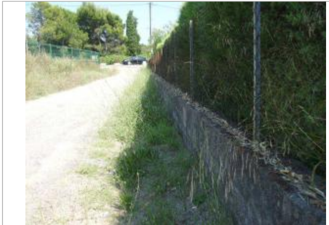
Vue générale - Auteur : EGIS Eau

Coordonnées WGS84 : X: 6.56586900 / Y: 43.47823000