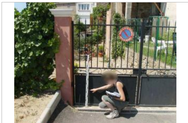
Vue rapprochée - Auteur : EGIS Eau

Code : VAR2010EGA_R_007_1 Date de mise à jour : 04/12/2019 Auteur : Cerema Méditerranée