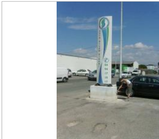
Vue générale