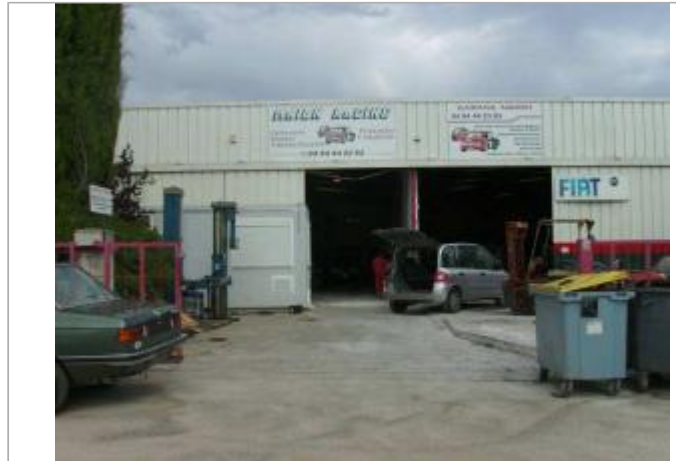
Vue générale - Auteur : EGIS Eau