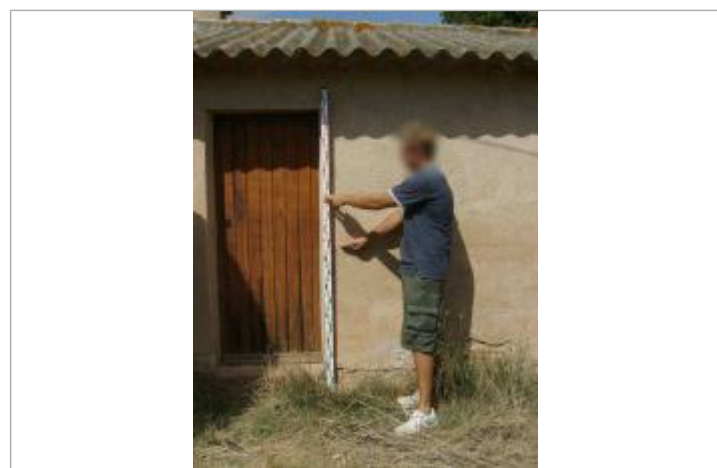
Vue rapprochée - Auteur : EGIS Eau