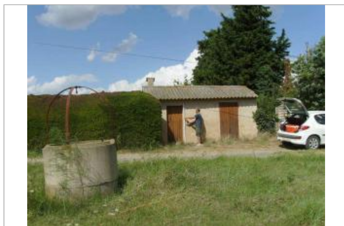
Vue générale - Auteur : EGIS Eau